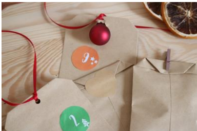
TÜTCHEN VERSCHLIEßEN, MIT KLEBESTREIFEN, KLAMMER ODER EINER SCHLEIFE