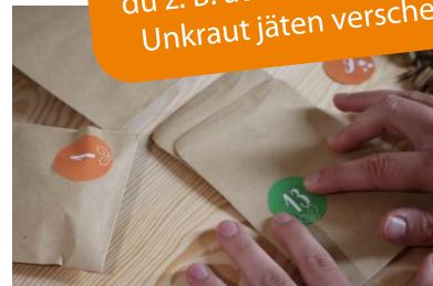
BUTTONS AUF DIE TÜTCHEN KLEBEN