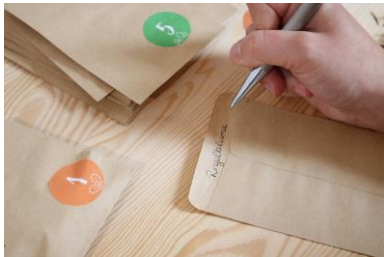
SORTENBEZEICHNUNG IM TÜTCHEN ODER AUF EINEM ZETTEL NOTIEREN