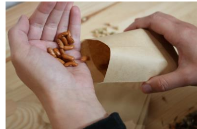
SAATGUT IN DIE TÜTCHEN EINFÜLLEN