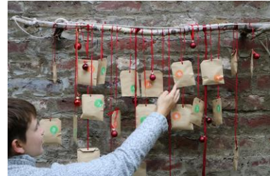
NUN DIE TÜTCHEN AN AST ODER KORDEL ANBRINGEN UND NACH LUST UND LAUNE DEKORIEREN

VIEL SPAß BEIM BASTELN WÜNSCHT DIR DEIN MEINE ERNTE TEAM