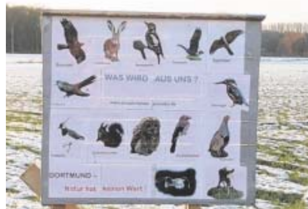
Ein Sportplatz mitten in der Landschaft würde den Lebensraum dieser Tiere weiter einengen, so die Bürgerinitiative.

Wie berichtet, stehen FDP und Grüne der Lösung kritisch gegenüber; SPD und CDU scheinen sich einig, dem SC Husen an der Kurler Straße einen Ausweg aus seinem jetzigen Dilemma anbieten zu wollen. Allerdings schwebt über dem Projekt die Haushaltsmiserere der Stadt.