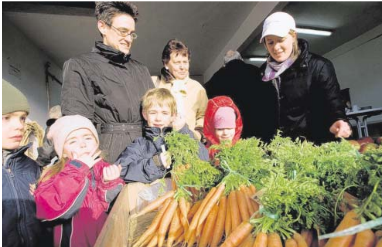
Kostprobe: Lecker schmeckt frisches Gemüse, das ohne jeden Umweg auf den Tisch kommt. 20 Interessierte sahen sich auf dem Hof Mertin in Grevel nach einem Mietgrundstück für den eigenen Ackerbau um.