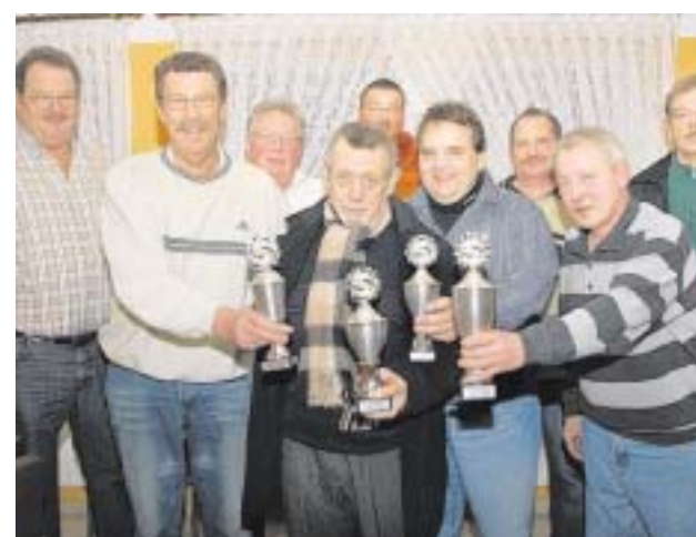
Erster, zweiter und dritter Vereinsmeister gemeinsam mit dem Träger des Raubfischpokals.