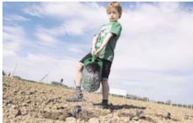
Nichts als Acker: Auch der Nachwuchs hat Spaß daran, ein Stück Boden fruchtbar zu machen.

sen.“ Seitdem habe sich das Ehepaar immer nach einem neuen Stück Land geseht. Und dieses neue Gemüsebeet sei eine kostengünstige Alternative (149 Euro pro Saison für 50 Quadratmeter) zu einem Grundstück in einem