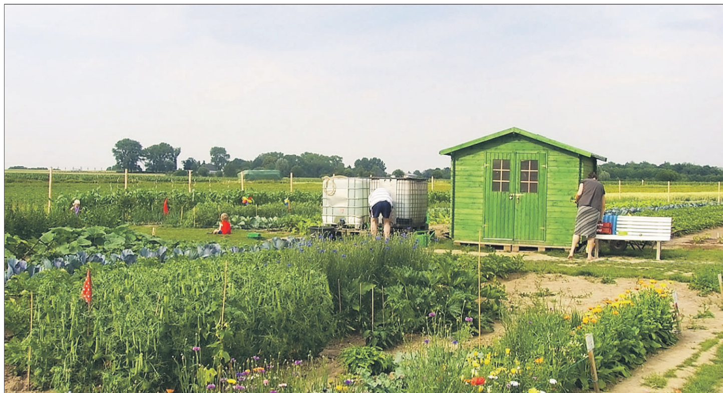
Dieses Bild zeigt das letztjährige Gemüsegarten-Projekt in Dortmund. Auch in Aachen wird die Idee in diesem Jahr umgesetzt.

Unternehmen aus Bonn startet in der Aachener Soers kreatives Projekt