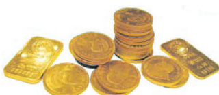
Super Kurs treibt Edelmetallbesitzer zum Verkauf.